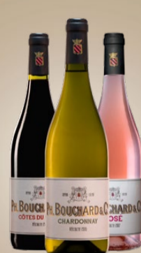
PH. BOUCHARD & CIE DÉCOUVRIR